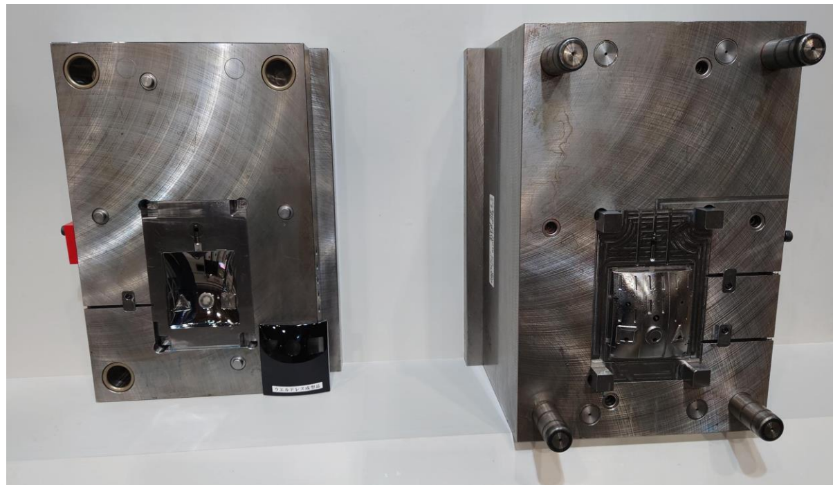
ウエルドネスサンプル